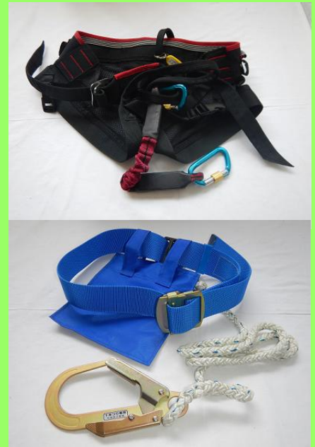
村山総合支庁北村山地域振興局